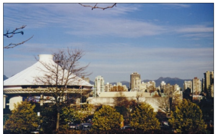
Moderne Architektur prägt das Stadtbild