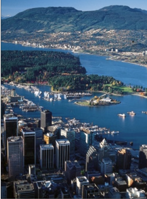
Blick auf Vancouver

dass durch eine Zusammenarbeit der einzelnen Maklerhäuser Immobilien schneller vermittelt werden könnten. Durch das MLS-System (multiple listing service) wird es möglich jedes beliebige Listing mit allen Einzelheiten aus dieser Datenbank abzurufen. Daher ist diese Datenbank, die nur ein Bestandteil des Real Estate Boards of Greater Vancouver ist, mit einer Immobilienbörse vergleichbar.